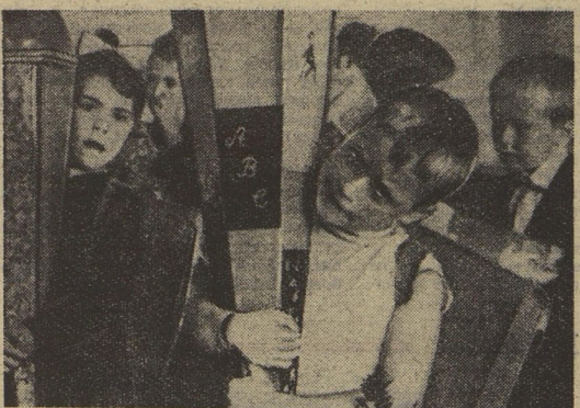
ГДР. Такие подарки получали все первоклассники. В этом году в республике их почти двести восемьдесят тысяч.