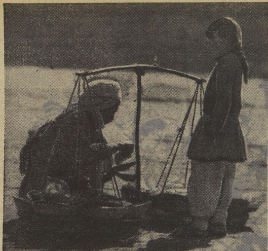
ИНДИЯ. Разве пройдёшь мимо этих весов на улице Дели? Любимое лакомство ребят — земляные орешки.

О. РУТКОВСКИЙ, преподаватель экономической географии.